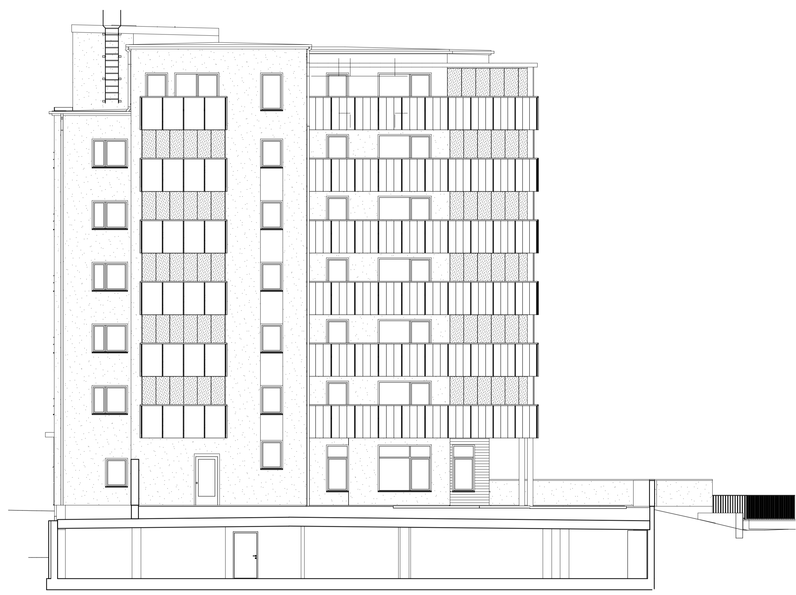
Fasad med väderskydd mot gården i norr, Hus 1

Så här hade det sett ut om vi inte hade glasracket framför.