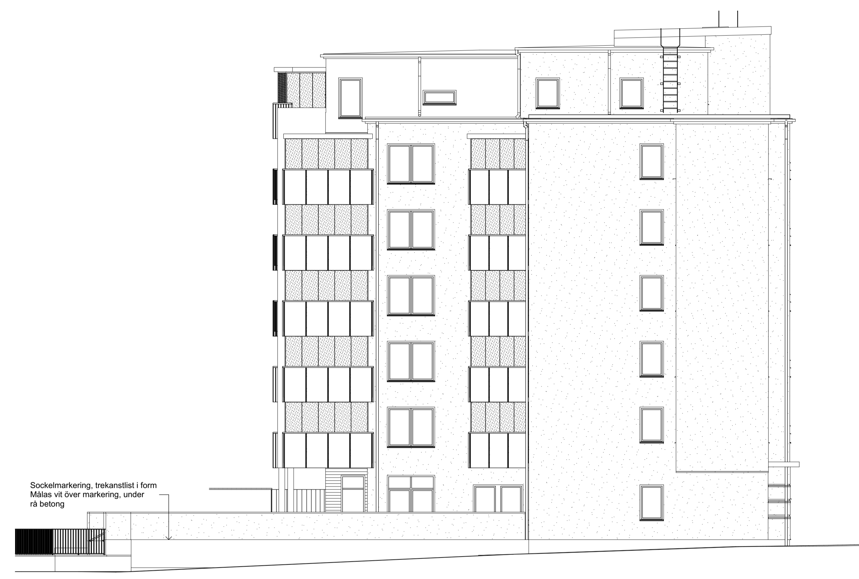
Fasad med väderskydd mot Petter Phils gata i söder, Hus 1